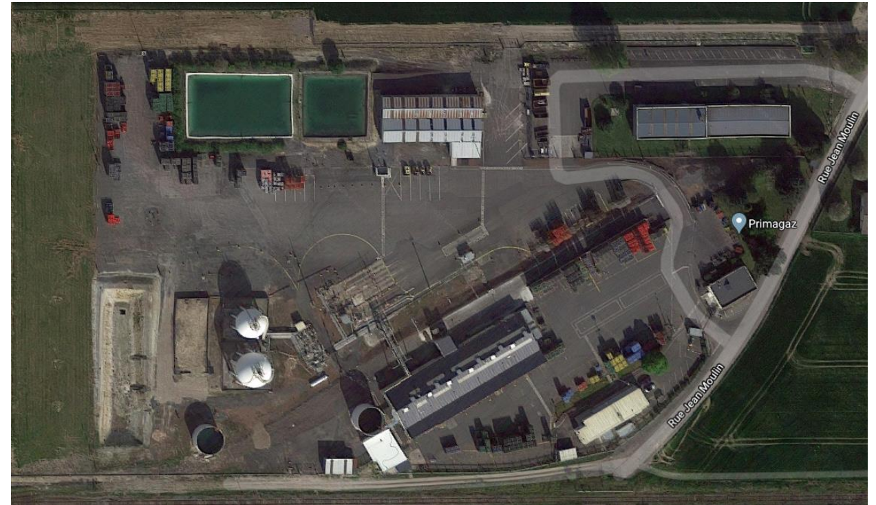
Photographie du site en 2019

* Avant prise en compte des travaux en 2019