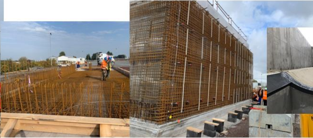
> Construction du sarcophage en béton armé