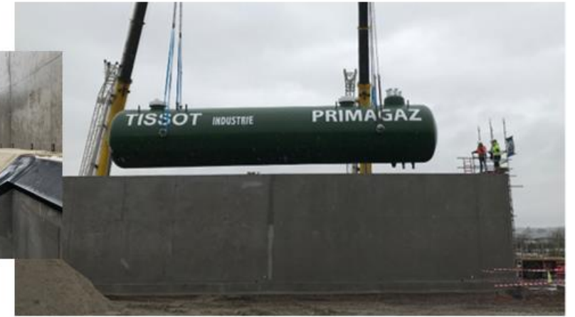
> Mise en place du réservoir