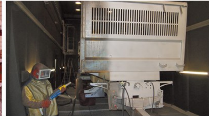
Grenailage et peinture en cabine