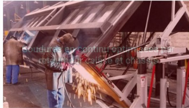
Soudures en continu optimisées par retourneur caisse et châssis